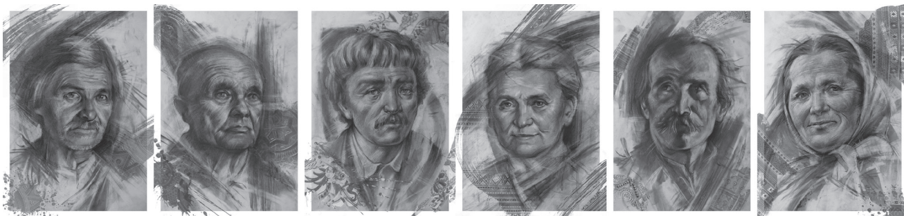
Іл. 8-13. М. Фроляк. Серія «Портрети народних майстрів Гуцульщини»

Під час експерименту митець формує взаємодію між академічними техніками й сучасними (цифровими) засобами вираження. Це дозволяє по-новому поглянути на портрет, зробити зображення багатовекторним, інтегруючи в нього не лише зовнішню подібність, а й сам дух творчості майстра, який, завдяки цифровим технологіям, стає невід'ємною частиною його візуального зображення.