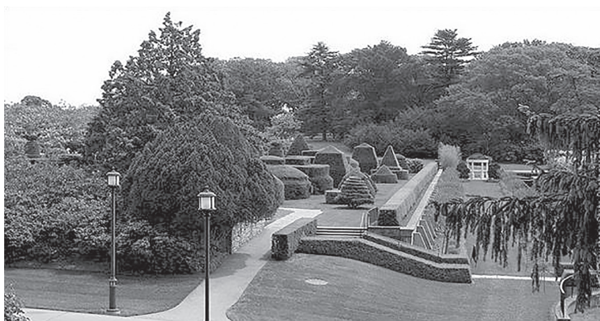
Фото 3. Сад Левенс Холл (Levens Hall Garden), Англія

Заключним етапом уроку має стати виконання самостійної практичної роботи . Учні пропонується створити сучасні топіарії – їх ще називають «Європейським деревом» або «Деревом достяга», формою вони дуже подібні до своїх римських предків, а ось виготовлені можуть бути з різноманітних