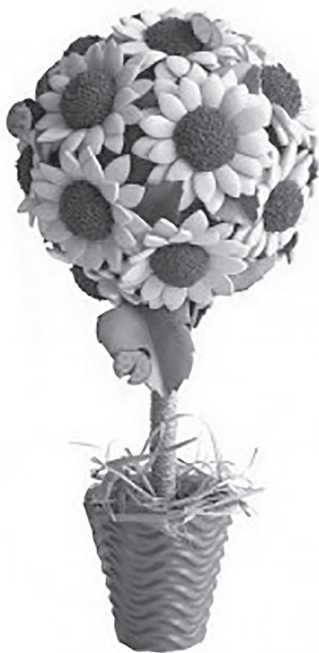
Фото 7. «Дерево щастя»

людини є синтезом художніх засобів, природних елементів і елементів благоустрою. Мистецтво фігурної стрижки дерев і чагарників є одним із найцікавіших напрямків ландшафтної архітектури. На жаль, в Україні сьогодні стрижка рослин застосовується нечасто і переважно для формування живоплотів різних видів, на відміну від країн Європи, де в останні роки топіарне мистецтво набуває все більшої популярності. Із впевненістю можна стверджувати, що в пошуках нових форм та вдалих композиційних прийомів у ландшафтній архітектурі варто звертатись саме до історичної спадщини садово-паркового мистецтва, адже вивірені сторіччями принципи формування ландшафту можуть знайти застосування й у сучасному міському середовищі.