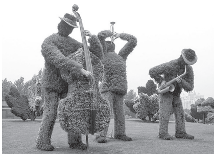
Фото 2. Сади Лонгвуда (Longwood Gardens), США

збереглися і радують око до нашого часу: