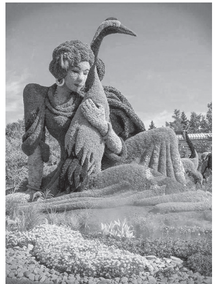
Фото 1. Сад Ледью (Ladew Topiary Gardens), США

Учні демонструють слайди і розповідають про топіарні сади, які