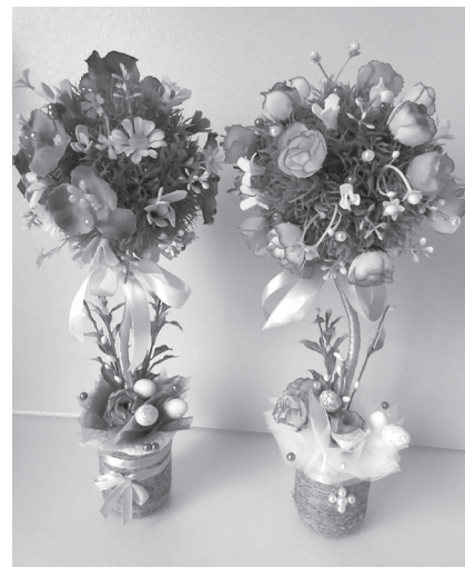
Фото 8. «Дерево щастя»

Стаття надійшла до редакції 10.01.2018 р.